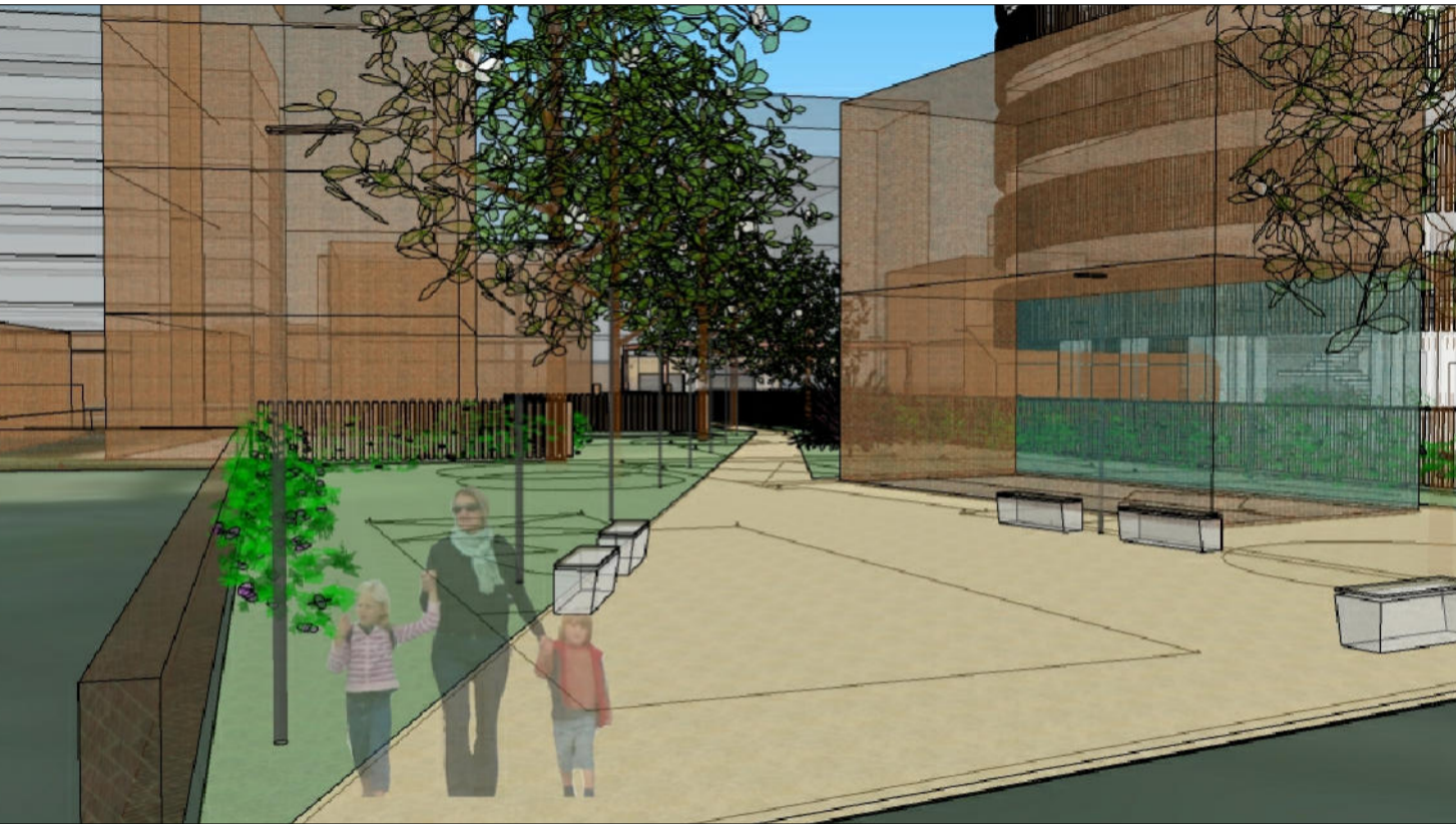
Oggetto : Planovolumetrico di progetto

data consegna: novembre 2021 scala : 1:200 tav. : 7 adottato: approvato: