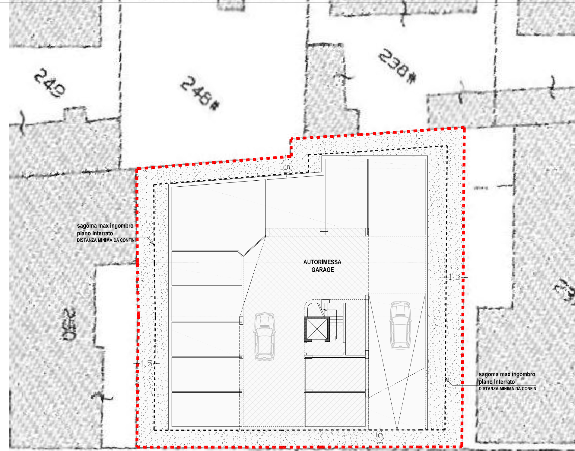
Planimetria piano interrato (Q.- 2,00 mt) con sagome edifici e distanze - scala 1:200

----- perimetro unità d'intervento demolizione con ricostruzione - art.9 lett. g) delle NTA del PRG